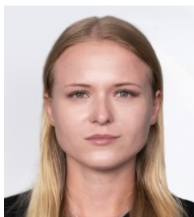
Фото соответствует возрасту. Лицо открыто, взгляд направлен в объектив камеры. Выражение – нейтральное.