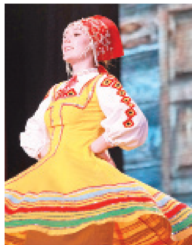
ансамбль танца КБГУ «Кафа», театр песни КБГУ «АмикС», театр танца «Каллисто» и др.

Центр эстетического воспитания и художественного творчества управления по молодежной политике и воспитательной работе курирует семь творческих коллективов, являющихся победителями и лауреатами всероссийских и международных конкурсов и фестивалей. В их числе народный